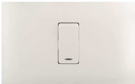
Diagrama de Instalación Interruptores