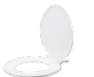
Asiento Redondo (E101.08)