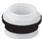
Spud de 1 1/2" para conexión de fluxómetro