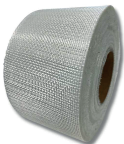
Malla para refuerzo de cubiertas