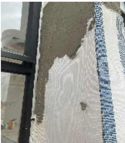
Malla para refuerzo de paredes